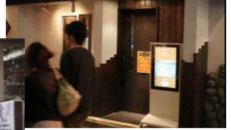
Model:R32FZP1WP2 Digital Media Frame , Water Proof Outdoor Floor Stand Type