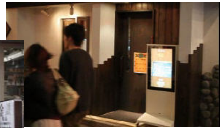
Model:R32K7WP2 Digital Media Frame , Water Proof Outdoor Floor Stand Type